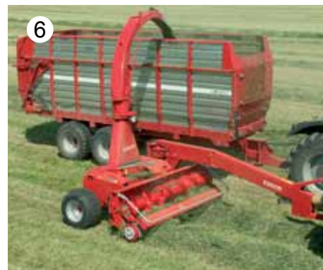
JF-STOLL precizni silažni kombajni imajo širino pobiralne naprave od 1,6 m do 3,1 m. (možno priključiti kosilnik, več redno koruzno enoto, Pick Up).