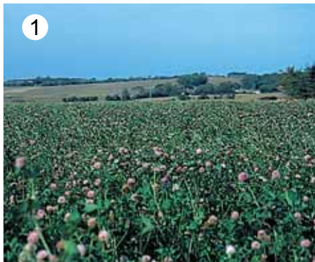
JF-STOLL ima kosilnike za vse vrste travinj.