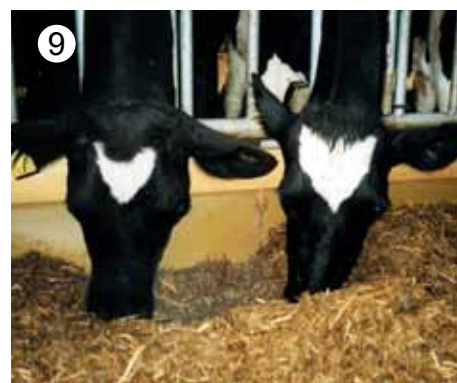
Z uporabo JF-STOLL strojev izboljšate tako tehnične kot finančne rezultate poslovanja.