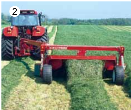
JF-STOLL kosilniki imajo delovno širino od 1,7m do 12 m. Imajo možnost širokega raztrosa, enojne ali dvojne redi.