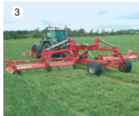
JF-STOLL je prvi razvil vlečen trojni kosilnik z širino 12 m.