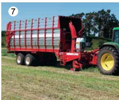
Silažni kombajn priključen na prikolico iz JF-STOLLa omogoča delo enega človeka pri veliki kapaciteti.