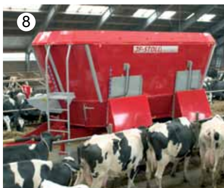
Proizvodni program JF-STOLL mešalnih vozov ima kapacitete volumna od 6,5 do 45 m 3 .