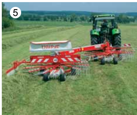
JF-STOLL proizvaja vrtavkaste zgrabjalnike delovne širine od 2,9 m do 8 m.