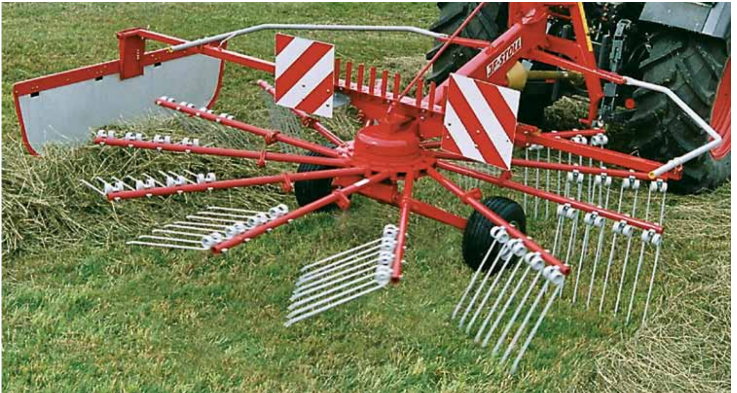
R 420 DS