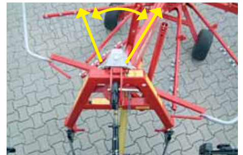
Gibljiv 3-točkovni priklop je oblikovan tako, da zgrabljalnik sledi traktorju ob zavijanju.