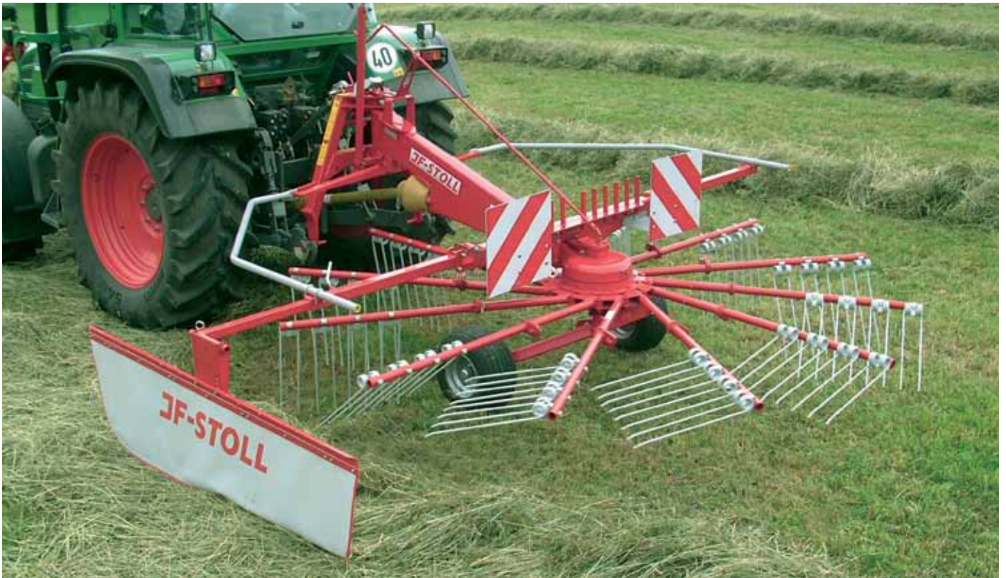
R 420 DS