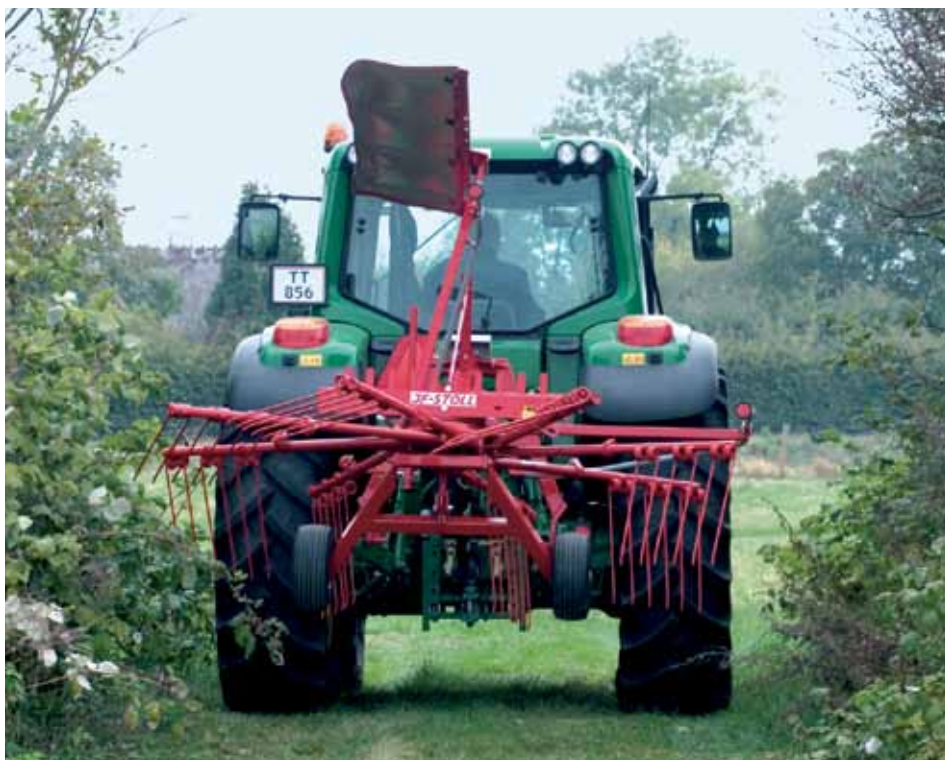
R 285 DS v transportnem položaju – z rokami vzmetnih prstov v nosilcu za transport.