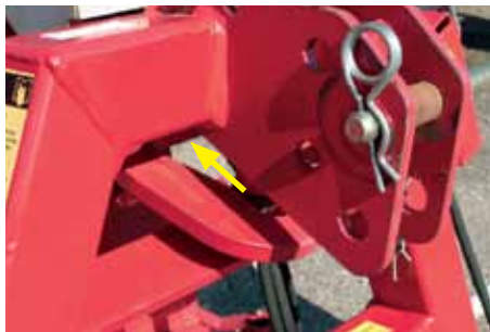
Gibljiv 3-točkovni priklop je standard.

Sistem prav tako zagotavlja, da zgrabljalnik sledi zavojem traktorja, kar daje dovolj prostora za krožne prehode tudi po neravnih terenih. Ko dvignemo zgrabljalnik, se avtomatsko postavi v nevtralno pozicijo, kjer se tudi zaklene. Zgrabljalnik R 460 DS ima blažilec tresljajev, kateri absorbira tresljaje med dviganjem.