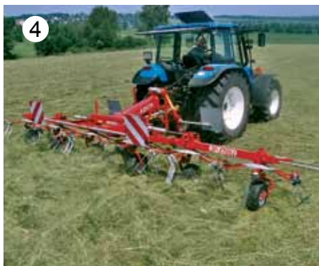
JF-STOLL proizvaja vrtavkaste obračalnike z delovno širino od 4,5 m do 9 m.