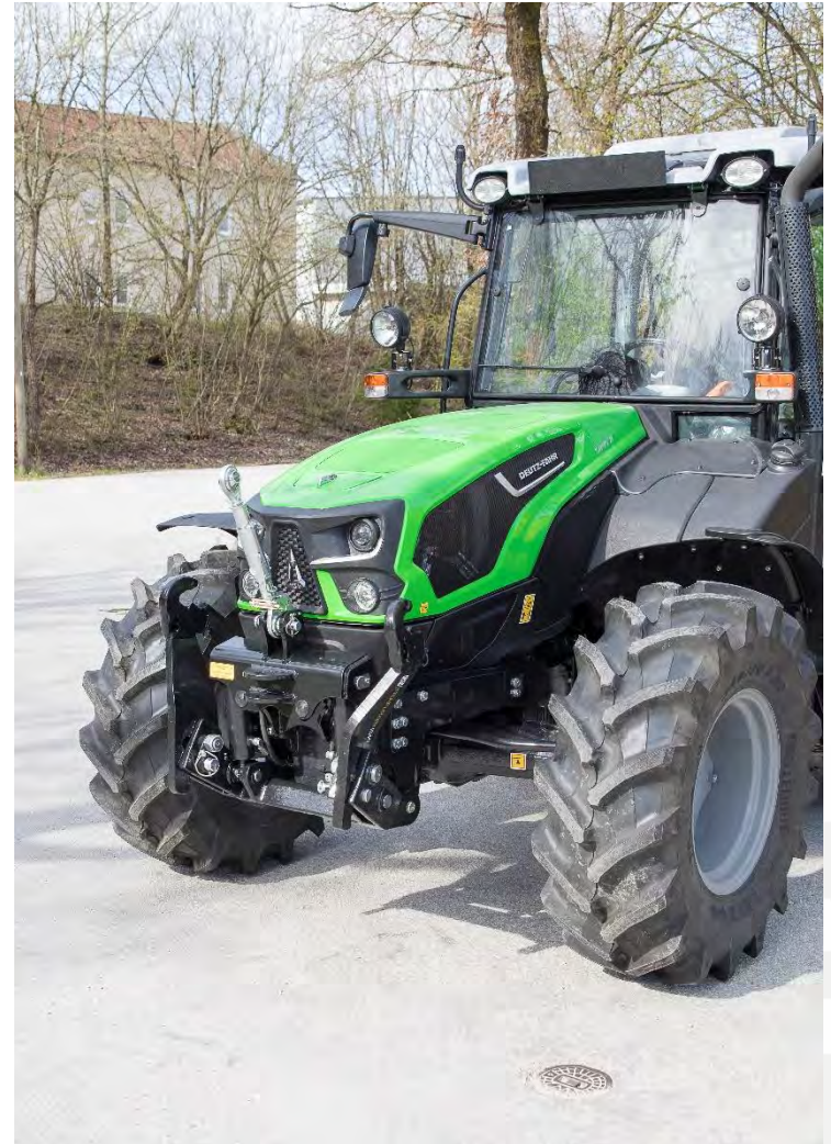
Fotos zeigen 5095D Tier 5

(ab Bj. 2022- / mit Vorbereitung am Vorderachsträger für Frontkraftheber und Frontzapfwelle)